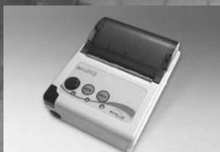
専用サーマルプリンター HS-P100