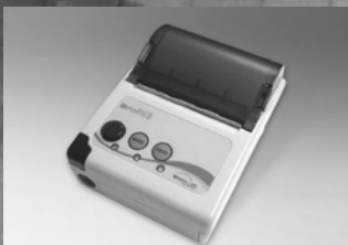
専用サーマルプリンター HS-P100